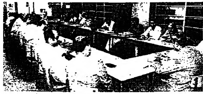
اساتذة الحقوق في اجتماعهم